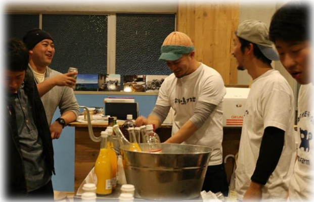
～かんきつジュース試飲会～

かんきつの加工品として、ストレートジュースはとても人気のある商品です。様々な品種の果汁を組み合わせれば風味の種類は無限大です。この面白さを消費者に伝えたいと考え、農業後継者 9 名を含む計 20 名で、“NPO 法人柑橘ソムリエ愛媛” を設立しました。その名前の通り、かんきつジュースのテイasting によるソムリエライセンス制度を確立するのが僕たちの目標です。試飲会や BAR イベントなど、メンバー全員で楽しみながら活動を展開しています。