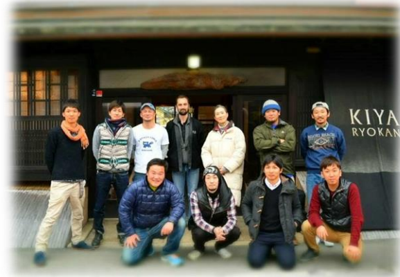
～NPO 法人柑橘ソムリエ愛媛メンバーと～