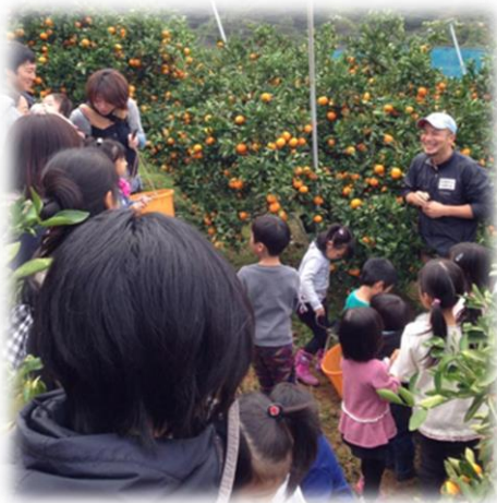
～地域児童の収穫体験～